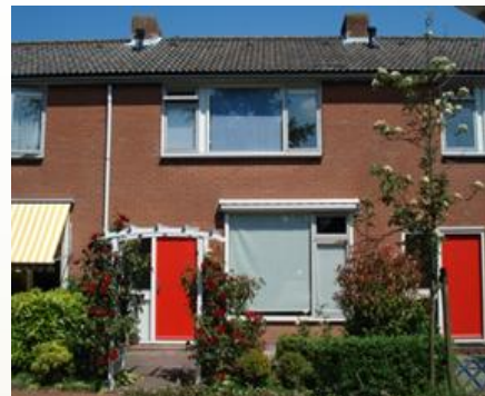
J.W. Frisoweg, tot €620,-