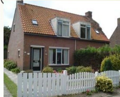
Wilhelminaweg, tot €660,-