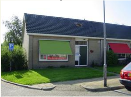
Emmaweg, tot €500,-